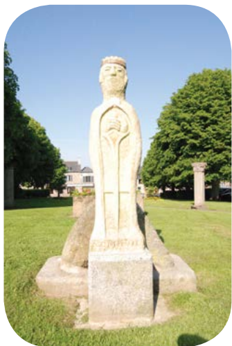
Devant la cathédrale Saint-Samson de Dol-de-Bretagne, une statue de Nominoë couronné a été inaugurée en 2010.