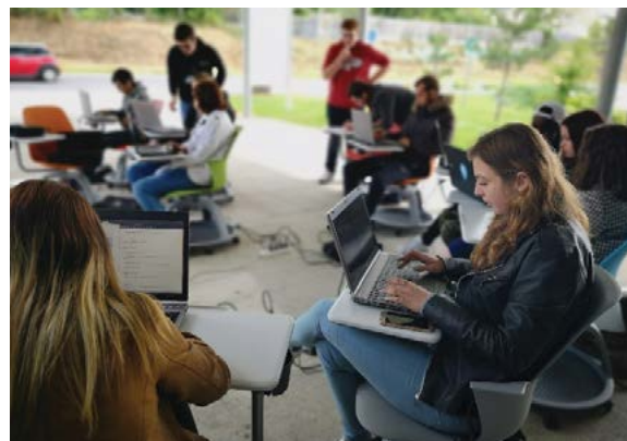
Intervention du Coding Club d'Epitech auprès des jeunes accompagnés