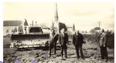
Les travaux de terrassement du futur terrain B