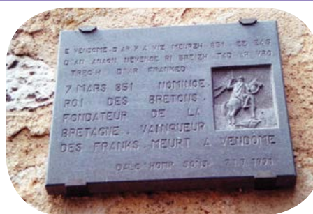
Plaque commémorant la mort de Nominoë à Vendôme (41), posée en 1991 par l'association Dalc'homp Soñj