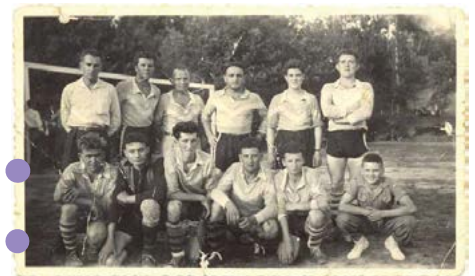
Jadis, à l'époque de La Vigne...

Des pages et des pages pourraient encore venir développer ces quelques mémoires du club, riche par bonheur de nombreuses images des diverses décennies traversées. Hélas, nous manquons d'informations sur ces photos, leurs années, les personnes qui y figurent, etc. Si vous avez des souvenirs, des témoignages, n'hésitez pas à nous contacter, chaque histoire des membres du club est précieuse.