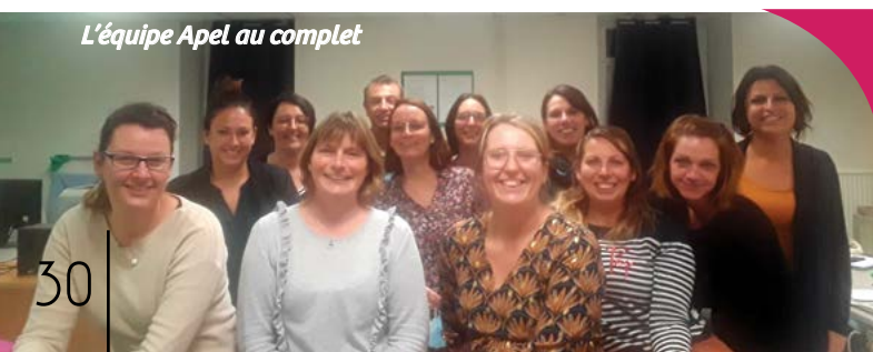
L'équipe Apel au complet

À noter : les portes-ouvertes de l'école sont prévues le 21 mai 2021.