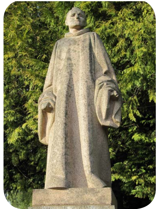
Statue de Saint Conwoïon située avenue de Beaumont à Redon

Tous les collégiens et lycéens de la cité scolaire Beaumont connaissent bien la statue du saint, sculptée en 1958 dans le granit rose du Trégor par Jean Fréour (1919 – 2010), le prolifique artiste renommé de Batz-sur-Mer. Cette silhouette élancée du moine dominant « sa » ville depuis la butte de Beaumont fut destinée à remercier le saint d'avoir protégé la ville pendant la seconde guerre mondiale.