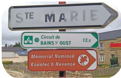
Fléchage du parcours vers le lieu-dit de la Bataille de Ballon, au départ du bourg.