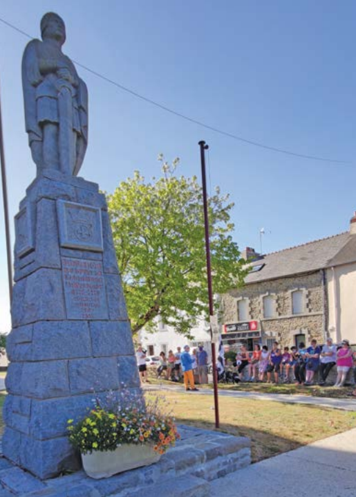
Départ d'une Balade cet été devant la statue érigée en 1952 (Photo Anthony Charton, août 2020)

Et chacun se souvient de la belle fête bretonne et médiévale qui fut organisée dans notre bourg par les municipalités de Bains et de Redon, le 26 mai 2018, pour accompagner l'inauguration du nouveau « Mémorial Nominoë » sur la prairie frairienne de La Bataille, là où se trouvait, selon les chroniques du Moyen-Âge, le petit monastère de Ballon... D'un style radicalement différent, c'est une mise en scène imaginée de la bataille de 845 entre Francs et Bretons, qui combine des matériaux traditionnels, schiste, châtaignier, granit, avec de l'aluminium, de l'acier, du cuivre, et même du cristal.