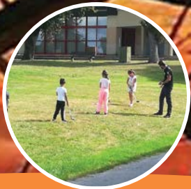
Page 30 Golf à l'école