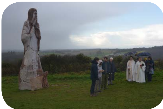
Vue de l'inauguration de la statue de St Konwoïon à Carnoët (22), le 11 décembre 2019.

Mais sait-on que la Vallée des Saints, cet incroyable paysage verdoyant de Carnoët (22), près de Carhaix, accueille déjà la silhouette de près de cent cinquante saints bretons monumentaux ? Et savez-vous que, dans ce paradis terrestre, se trouve, depuis l'hiver dernier, une grande statue du moine redonnais Conwoïon ? C'est en décembre 2019 qu'elle a été inaugurée, en présence d'une délégation du pays de Redon, et des représentants du mécène Denis-Matériaux, qui a choisi pour son entreprise bretonne cet emblème du bâtisseur de l'abbaye de Redon.