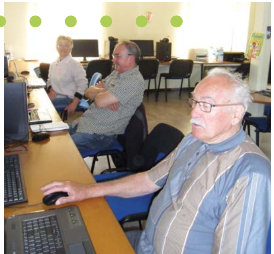
Se familiariser avec l'informatique...

Pour certains d'entre nous (sénior), l'informatique paraît abstrait et complexe. Notre mission est de le rendre accessible au plus grand nombre, se décomplexer en apprenant simplement, voire de façon ludique...et dans la bonne humeur !