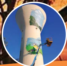
Page 5 Relooking