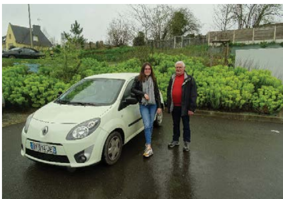
Véhicule conduite accompagnée

Vous devez commencer un emploi, un stage, une formation et avez besoin d'un moyen de déplacement ? La Mission locale gère un parc de scooters ainsi que deux voitures qui peuvent être mis à disposition pour