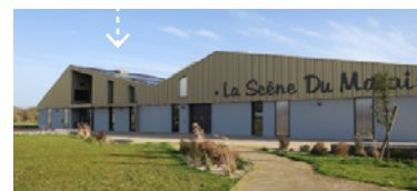
La scène du Marais et ses ombrières photovoltaïques