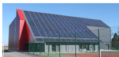
la halle de raquettes, construite en 2013

Les élus ont d'abord commencé avec les projets d'achat-revente d'électricité solaire avec les installations photovoltaïques des bâtiments du parc sportif. Depuis 2010 sept sites ont été équipés de panneaux solaires photovoltaïques : trois nouveaux (halle à raquettes, bâtiment sportif et maison de l'enfance) et quatre anciens (deux écoles, le hangar des carnavaliers et les services techniques).