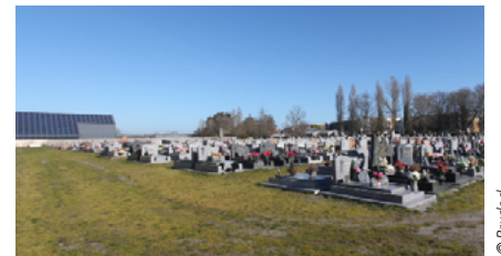
Le cimetière, recevra prochainement la centrale solaire citoyenne

La commune s'ouvre au portage citoyen. Une communauté d'énergie citoyenne est en cours de constitution pour financer les panneaux et c'est elle qui décidera du choix du prestataire. Chaque famille disposant d'un compteur linky pourra acquérir quatre panneaux pour le prix de 1800 euros HT et consommer leur production