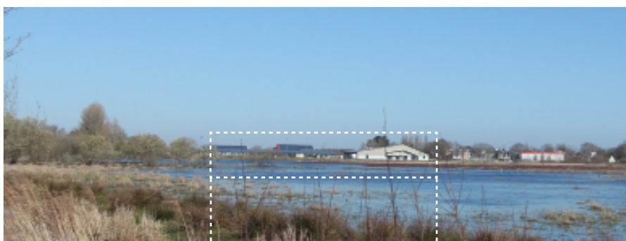
Une centrale solaire au coeur du parc naturel régional de brière

La transition énergétique de la commune est née de la prise de conscience de la baisse des dotations de l'état et de la montée des prix de l'énergie. À cette époque le coût de fonctionnement des bâtiments communaux atteint un million d'euros. Parallèlement, la commune veut investir dans de nouveaux équipements sportifs sans augmenter les frais de fonctionnement. Le choix du solaire s'est opéré autour ce double objectif : investissement et réduction des coûts.